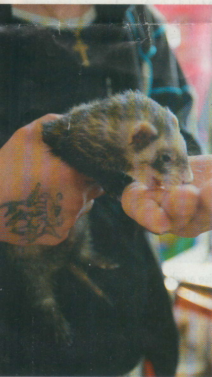
Lola, la furette, mange dans la main de son détenant « référent ».